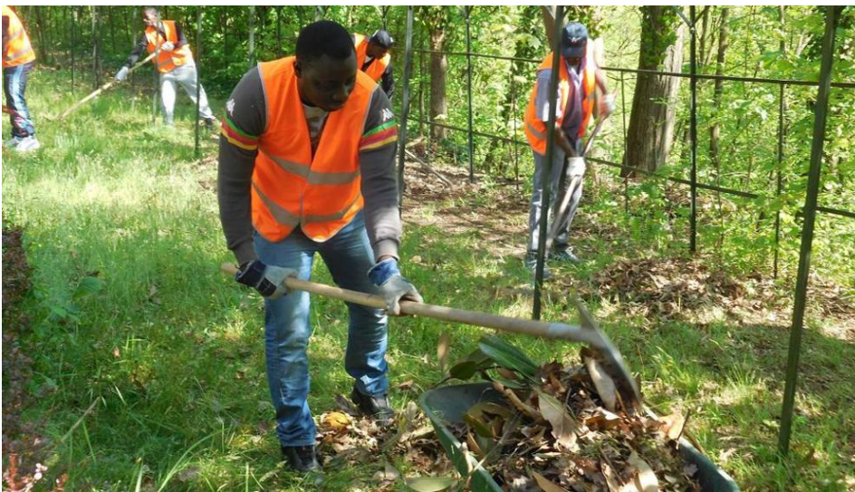
Agricoltura e montagna si stanno spopolando

Saccone vede i rappresentanti di "Senza Asilo": ma le regole si rispettano